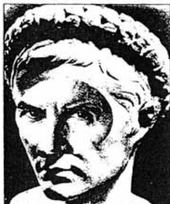
OUTRO DESTAQUE da mostra é "Cavo um fóssil repleto de anzóis", de Odires Miászho

● LINHA IMAGINÁRIA - Mostra coletiva. Abertura hoje, às 20h, na Sala Arlinda Corrêa Lima do Palácio das Artes (evento de Afonso Pena, 1.537, Centro). Aberto até 2 de maio.