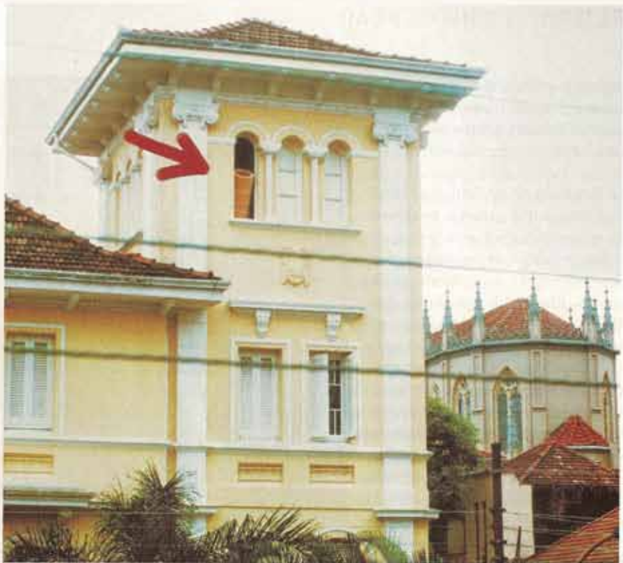
PESO. Escultura de 40 metros, feita com arruelas de madeira coladas, do artista cearense Eduardo Frota, criada para o espaço Torreão, em Porto Alegre

As organizações convidadas pelo Panorama são o Alpendre, espaço multidisciplinar de Fortaleza, o Torreão, o Agora/Capacete e o Linha Imaginária , projeto que realiza exposições independentes e reúne atualmente 470 artistas de todo o Brasil. A atuação do Linha , coordenado pelos artistas Sidney Philocreon e Mônica Rubinho, de São Paulo, consiste em elaborar propostas